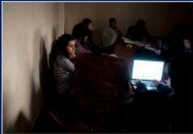
ဒီမိုကရေစီ ကိုတောင်းဆိုသည့် မိုရိုကို နိုင်ငံမှ လူငယ် သပိတ်စခမ်း။

ယနေ့ အာရပ် ကမ္ဘာ တွင် ဖြစ်ပွားနေသော ဒီမိုကရေစီ တော်လှန်ရေးများ တွင် ပါဝင်ဆင်နွှဲနေကြသည် မှာ အသက် ၃၀ အောက် လူငယ်များသာ ဖြစ်ကြပြီး အာရပ်နိုင်ငံများ ကိုလိုနီ ၁၀ မှ လွတ်မြောက် ပြီးသည့် နောက်ပိုင်း အာရပ် ကမ္ဘာ တွင် အာဏာရှင် များ ခိုင်မာလာသည့် အချိန် အတွင်းတွင် မွေးဖွား လာသူများ ဖြစ်ကြသည်။ ငြိမ်းချမ်းစွာ ဆန္ဒ ပြကာ ပါတီရုံ ဒီမိုကရေစီ ကိုတောင်းဆို ရန် အတွက် သူတို့ အရင် မျိုးဆက် ဟောင်း တို့ ထံမှ စံနမူနာ ယူစရာ ခေါင်းဆောင်များ၊ အတွေး အခေါ် များ လမ်းညွှန် အဖြစ် ရှိနေကြ သည် မဟုတ်ပါ။ အမှန်မှာ သူတို့ ၏ နောင်တော့ နောင် တော် များ သည် အာရပ် အာဏာရှင်တို့ကိုဆန့်ကျင်ရာတွင် အစွန်းရောက် အကြမ်း ဖက်ကာ ဘာသာရေး ကို အခြေပြု သည့် နည်းကို သာ လျှင် တခုတည်းသော ထွက်ရပ် လမ်း အဖြစ် ယုံကြည် သူ များဖြစ်ကြသည်။ ယနေ့ လူငယ်တို့မှာ အာရပ် ကမ္ဘာ တခုလုံး ၏ ၆၀% ရှိပြီး ပျမ်းမျှ အသက် သည် ၂၆ ခန့်ရှိကြသည်။ ယနေ့ အာရပ်လူငယ်များ က ဖေ့စ်ဘုတ် နှင့် အွန်လိုင်း လက်နက် တို့ ကို အသုံးပြုကာ တရားမျှတမှု၊ လွတ်လပ်မှု နှင့် ဒီမိုကရေစီရေး တောင်းဆို လှုပ်ရှားခြင်း သည် Muslim Brotherhood နှင့် Al Qaida တို့ ၏ လှုပ်ရှားမှု များ ထက် အဆမတန် ပိုမို ဤ စွမ်းအား ထက်ကြောင်း လက်တွေ့ ပြသ လိုက် ကြပြီဖြစ်သည်။