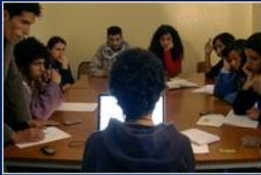
ပါတီရုံ ဒီမိုကရေစီ ကိုတောင်းဆို သည့် မိုရိုကို လူငယ် ခေါင်းဆောင် များ ၏ အစည်းအဝေး။

ယနေ့ အာရပ် ကမ္ဘာ တွင် ဖြစ်ပွားနေသော ဒီမိုကရေစီ တော်လှန်ရေးများ တွင် ပါဝင်ဆင်နွှဲနေကြသည် မှာ အသက် ၃၀ အောက် လူငယ်များသာ ဖြစ်ကြပြီး အာရပ်နိုင်ငံများ ကိုလိုနီ ၁၀ မှ လွတ်မြောက် ပြီးသည့် နောက်ပိုင်း အာရပ် ကမ္ဘာ တွင် အာဏာရှင် များ ခိုင်မာလာသည့် အချိန် အတွင်းတွင် မွေးဖွား လာသူများ ဖြစ်ကြသည်။ ငြိမ်းချမ်းစွာ ဆန္ဒ ပြကာ ပါတီရုံ ဒီမိုကရေစီ ကိုတောင်းဆို ရန် အတွက် သူတို့ အရင် မျိုးဆက် ဟောင်း တို့ ထံမှ စံနမူနာ ယူစရာ ခေါင်းဆောင်များ၊ အတွေး အခေါ် များ လမ်းညွှန် အဖြစ် ရှိနေကြ သည် မဟုတ်ပါ။ အမှန်မှာ သူတို့ ၏ နောင်တော့ နောင် တော် များ သည် အာရပ် အာဏာရှင်တို့ကိုဆန့်ကျင်ရာတွင် အစွန်းရောက် အကြမ်း ဖက်ကာ ဘာသာရေး ကို အခြေပြု သည့် နည်းကို သာ လျှင် တခုတည်းသော ထွက်ရပ် လမ်း အဖြစ် ယုံကြည် သူ များဖြစ်ကြသည်။ ယနေ့ လူငယ်တို့မှာ အာရပ် ကမ္ဘာ တခုလုံး ၏ ၆၀% ရှိပြီး ပျမ်းမျှ အသက် သည် ၂၆ ခန့်ရှိကြသည်။ ယနေ့ အာရပ်လူငယ်များ က ဖေ့စ်ဘုတ် နှင့် အွန်လိုင်း လက်နက် တို့ ကို အသုံးပြုကာ တရားမျှတမှု၊ လွတ်လပ်မှု နှင့် ဒီမိုကရေစီရေး တောင်းဆို လှုပ်ရှားခြင်း သည် Muslim Brotherhood နှင့် Al Qaida တို့ ၏ လှုပ်ရှားမှု များ ထက် အဆမတန် ပိုမို ဤ စွမ်းအား ထက်ကြောင်း လက်တွေ့ ပြသ လိုက် ကြပြီဖြစ်သည်။